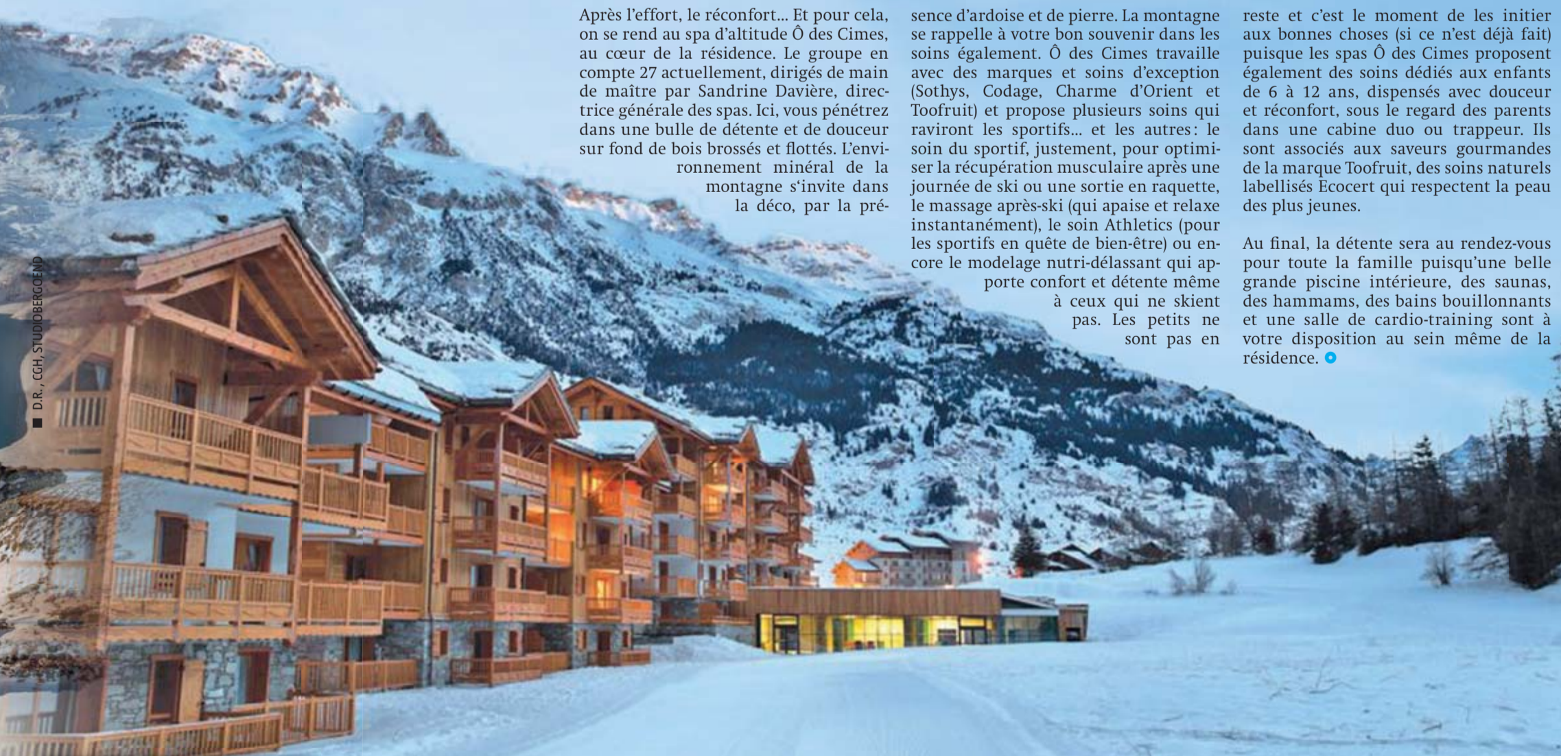
Au cœur de la jolie station de Val Cenis.

Au final, la détente sera au rendez-vous pour toute la famille puisqu'une belle grande piscine intérieure, des saunas, des hammams, des bains bouillonnants et une salle de cardio-training sont à votre disposition au sein même de la résidence. ●